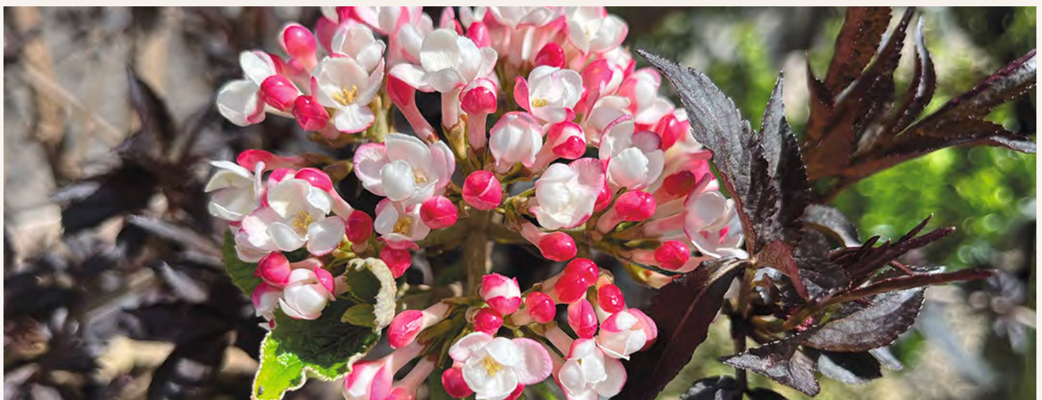
Osterschneeball – Viburnum x burkwoodii „Mohawk“, Wuchshöhe: 2 – 3 m hoch und breit, duftende Blüten im April, durchlässiger, humoser Boden, rot-gelbe leuchtende Herbstfärbung.

ECHT SICHER - ☎ 07225 / 981638 - 0 Bahnhofstr. 1 - 76571 Gaggenau - www.echtsicher.de