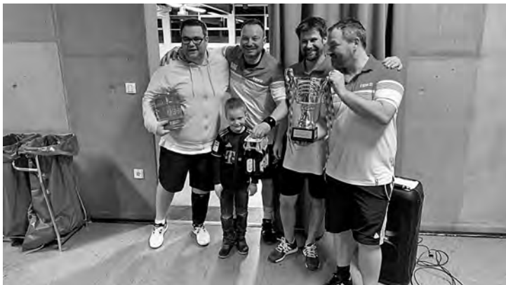
Das Siegerteam im Mixed-Wettbewerb: BBL

Nach tollen Spielen und angefeuert durch zahlreiche Zuschauer kehrte BBL im Mixedwettbewerb nach dem zweiten Platz im Vorjahr wieder zu alter Stärke zurück und eroberte sich den Titel. Als Premiersieger des Damenwettbewerbs trug sich der TCI in die Geschichtsbücher ein.