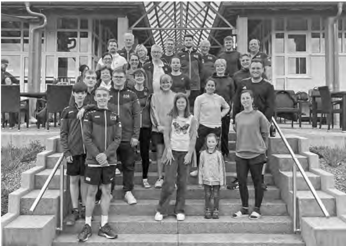
Die Teilnehmer am Eröffnungsturnier