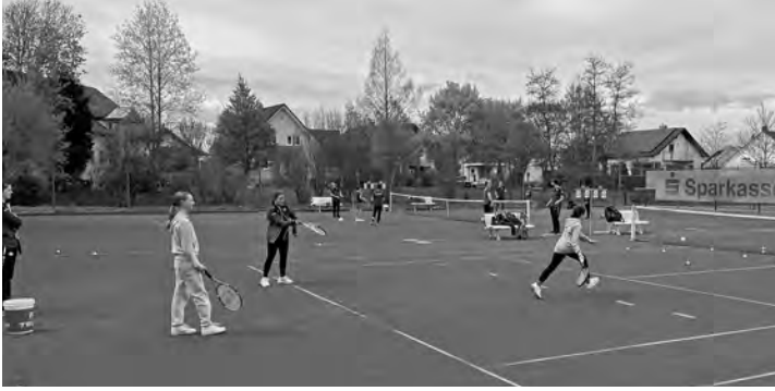
Die Jugend in Aktion

Wer Interesse hat, Mitglied im Tennisclub Iffezheim zu werden, kann sich im Internet unter www.tennisclub-iffezheim.de informieren und anmelden.