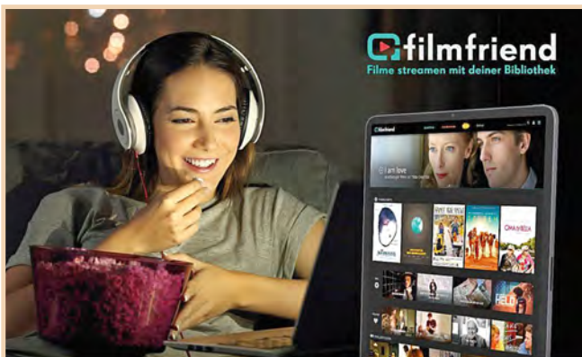
Aktuell: Kollektion "New York, New York"

Beißen Sie mit Filmfreund in den berühmtesten Apfel der Welt, indem Sie sich durch atmosphärische New-York-Filme inspirieren und verwöhnen lassen!