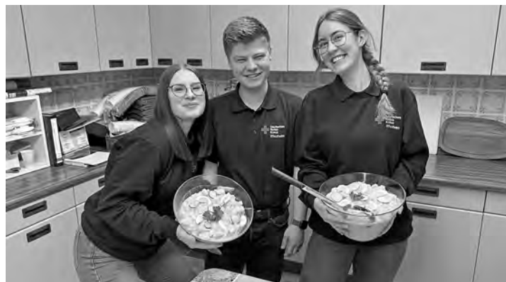
Unsere „jungen Aktiven“ bei der Vorbereitung des Imbisses, mit Spaß an der Arbeit

Zum Abschluss bedankte sich der Vorsitzende nochmal bei allen Anwesenden und lud zur Stärkung und in gemütlicher Runde ein, was dann auch gerne angenommen wurde.