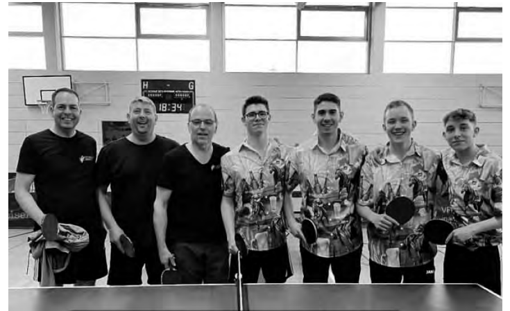
Die Teams des MGV

Die Tischtennisabteilung des MGV hat auch in diesem Jahr beim Vereinsturnier des TTI wieder zugeschlagen: nach sehenswerten und teils hart umkämpften Spielen kam am Ende des Turniers für die Sänger einmal mehr ein dritter Platz im Gesamtklassement heraus!