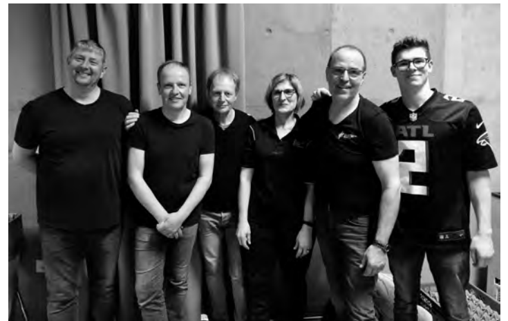
Den 3. Platz teilten sich „Stahl RMT“ und die erste Mannschaft des MGV