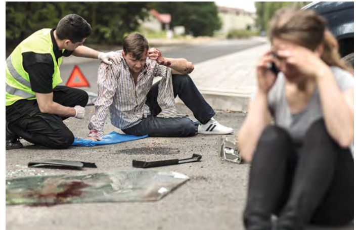
Jeder Mensch in Deutschland ist dazu verpflichtet, im Rahmen seiner Möglichkeiten Maßnahmen zur Rettung und Versorgung von Unfallopfern zu ergreifen.

Warndreieck, Warnweste und Verbandskasten müssen im Auto immer mitgeführt werden. Bei fehlender Ausstattung müssen Fahrzeughalter ein Verwarngeld von fünf bis 15 Euro zahlen. Gesetzlich vorgeschrieben ist zwar nur eine Warnweste pro Pkw – es empfiehlt sich jedoch eine Weste pro Mitfahrer, um bestmöglich abgesichert zu sein.