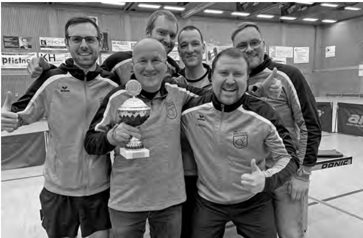
Die zweite Herrenmannschaft des TTC Iffezheim