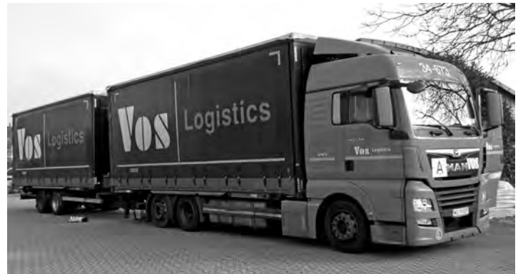
Der Lkw mit Anhänger war binnen weniger Stunden mit Gebrauchtkleidern gefüllt.

Ein Dank gilt allen Spendern von Gebrauchtkleidern, sowie den zahlreich erschienen Helferinnen und Helfern bei der Sammlung! Ebenso auch an die Jugendgruppen unserer Kolpingsfamilie, die die Kleidersäcke an den Tagen zuvor an die Iffezheimer Haushalte verteilt hatten.