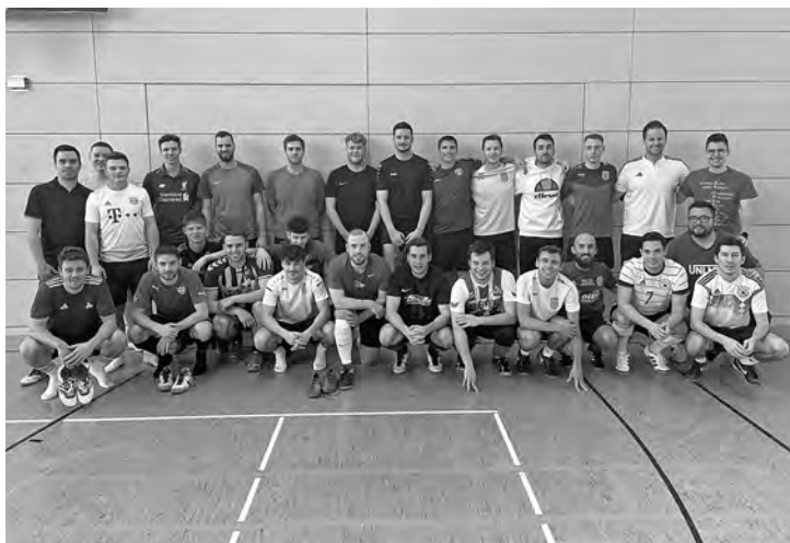
Ob drin oder draußen - hoch motiviert bei der Vorbereitung, unsere Seniorenteams!

Bitte beachten: Gerade in der Vorbereitungszeit können sich Spielzeiten und Termine oftmals auch kurzfristig ändern, daher sicherheitshalber immer auch einen Blick auf Fussball.de werfen.