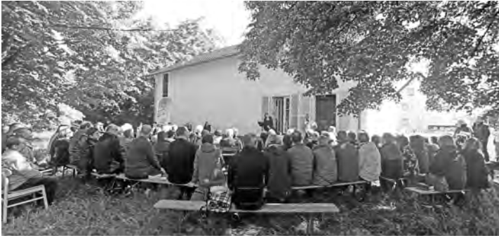
Während der Ansprache