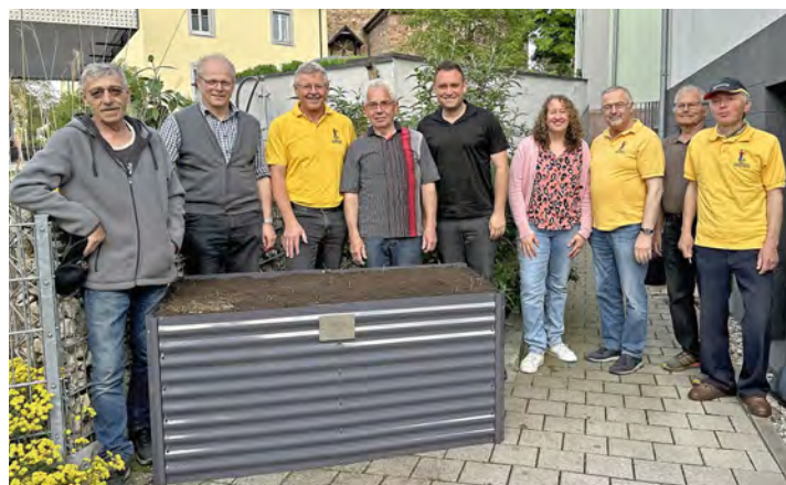
Das Hochbeet ist fertig

Als unterste Schicht wurde beim Iffothek-Hochbeet grober Baum- und Strauchschnitt wie Äste, Zweige und Laub verwendet. Danach folgte Rasenschnitt, Häckselgut und Pappe. Gedüngt wurde das Iffothek-Hochbeet mit Mist und Komposterde. Hochwertige Gartenerde oder Mutterboden bilden die oberste Schicht.