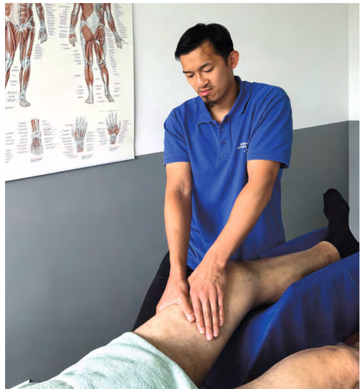
Manuelle Lymphdrainage am Knie

Die apparative Lymphdrainage: bei der gerätegestützten, äußerst entspannenden Massage, wird Luft in einer Gleitwelle in eine Kompressionshose eingeleitet. Der Lymphfluss wird dabei ebenso angeregt wie der Rücktransport von venösem Blut, sodass Stoffwechselendprodukte aus dem Gewebe abtransportiert und ausgeschieden werden können. Die Massage ist daher besonders geeignet für die Bekämpfung von Cellulite, Besenreisern, und Schwellungen. Der Stoffwechsel erhöht sich bei dieser Behandlung, was sich in einem erhöhten Harndrang bemerkbar macht. In einer Studie mit Sportlern wurde der positive Einfluss auf Gewebe und Blutparameter eindeutig nachgewiesen.