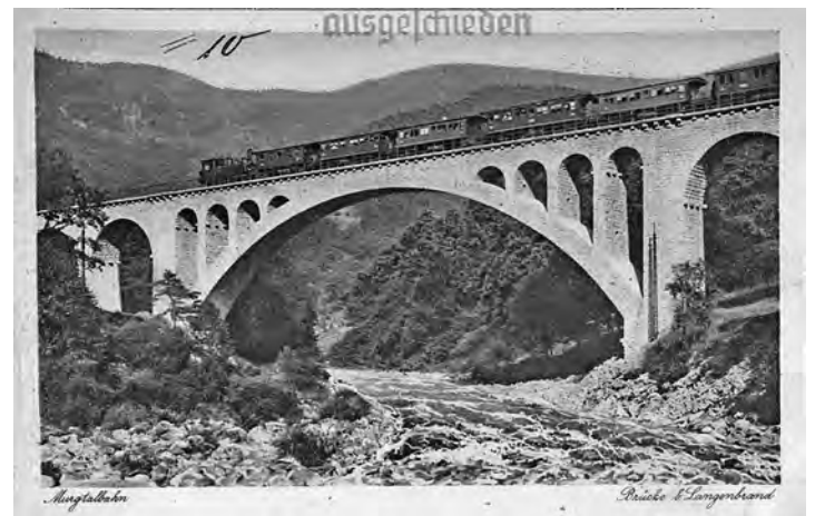
Historische Aufnahme der Murgtalbahn, um 1915.