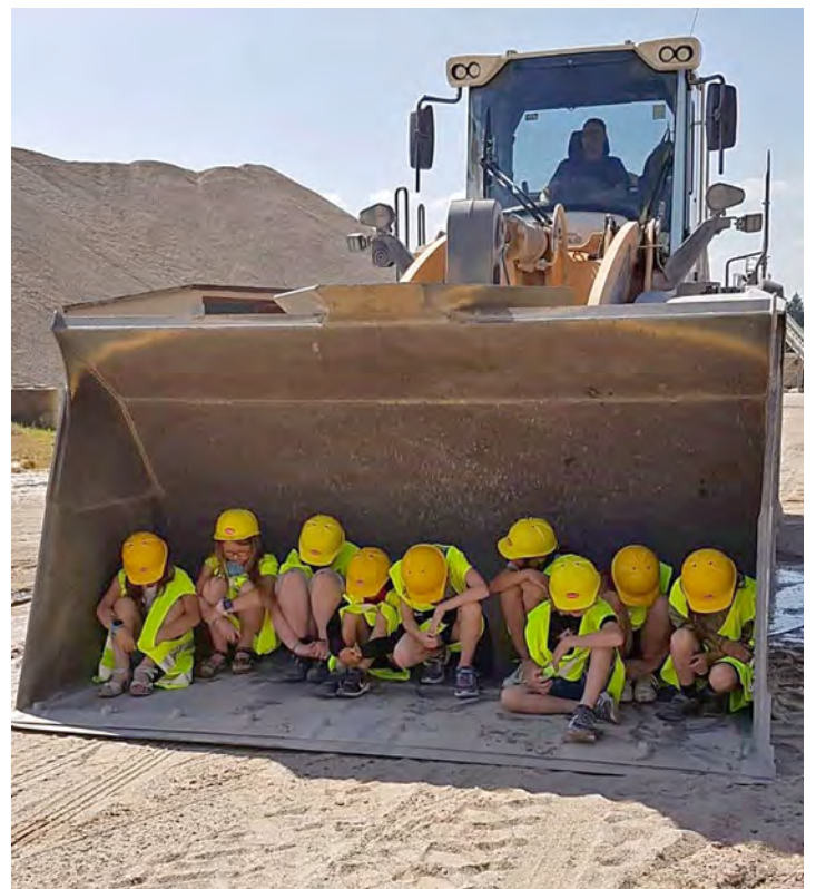
Kieswerk Kern live!

Mopädd freut sich bereits auf die gemeinsame Zeit in den Sommerferien und wir alle hoffen auf reichlich Anmeldungen.