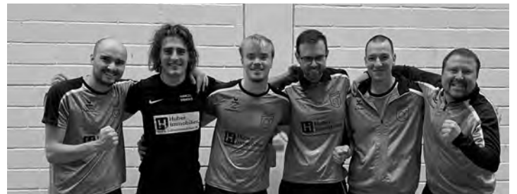
Herren 1 liegen gut im Rennen

Die Herren 1 freuen sich auf zahlreiche Zuschauer am kommenden Samstag um 15.00 Uhr gegen Goldscheuer sowie am Sonntag um 11.00 Uhr gegen Offenburg in der Iffzer Sporthalle.