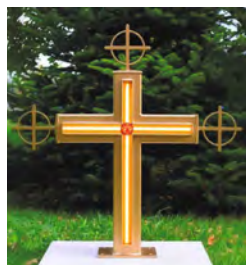
Kreuz beleuchtet bei Tag, 80 cm hoch