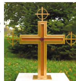
Kreuz unbeleuchtet bei Tag, 80 cm hoch