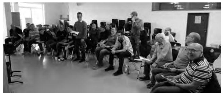
Die Erleuchteten, bitte aufstehen!