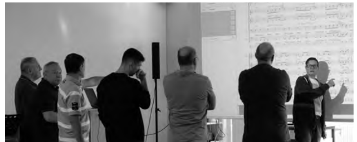
Aufmerksam, ihr Tenöre: So sehen Noten aus!