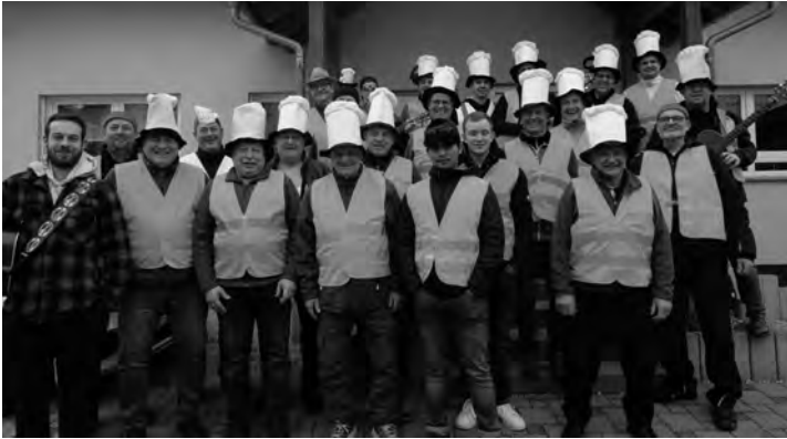
Der Start in einen langen Tag...

Wir bedanken uns bei allen, die uns für diesem langen entbehrungsreichen Weg mit der notwendigen Wegzehrung ausgestattet haben. Wir bedanken uns auch nochmals bei den Gästen unseres Kappenabends und freuen uns schon jetzt auf den kommenden.