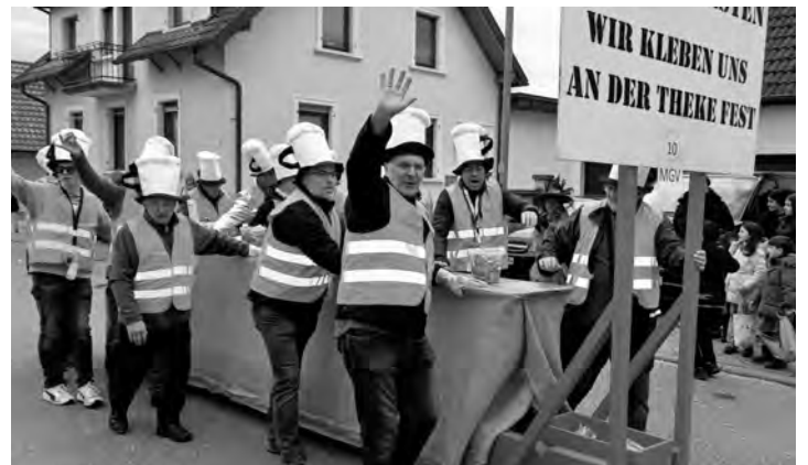
An der längsten Theke des ganzen Umzugs

Am Rosenmontag setzten die Sänger mit ihrem traditionellen „Zug durch die Gemeinde“ einen furiosen Schlusspunkt hinter die Fastnacht 2024. Zuvor hatten die Narren des Gesangvereins (mancher ist das ja eher „undercover...“) einen grandiosen Kappenabend, die Rathausstürmung sowie einen tollen Auftritt mit der längsten Theke im gesamten Umzug hinter sich gebracht.