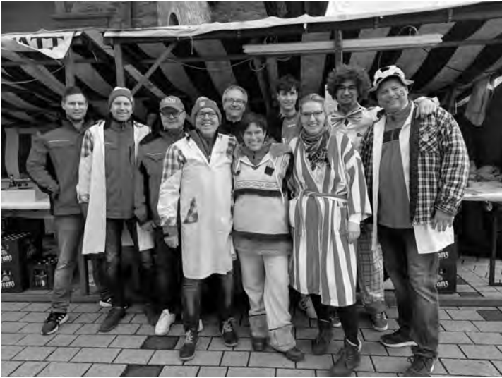
Das Verkaufsteam am Rathaus