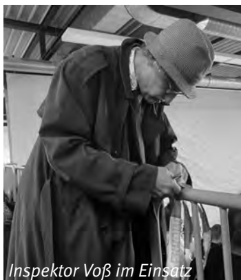
Inspektor Voß im Einsatz

Mit diesen Worten begrüßte ein Schauspieler, als Inspektor Voß, die Schüler/innen der 9. und 10. Klassen auf ihrem Weg zur Theateraufführung in der Sporthalle.