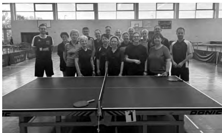
Teilnehmerfeld der Mixed-Meisterschaften