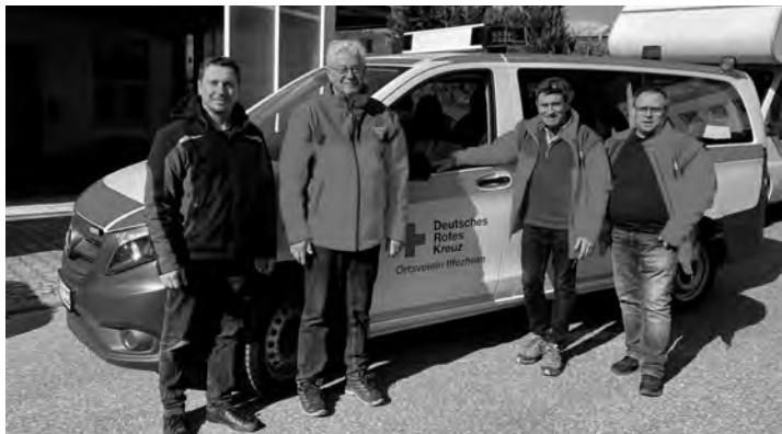
Fahrzeugübergabe in Maulbronn

Anfang der Woche konnte eine Delegation der Vorstandschaft endlich unser neues Einsatzfahrzeug vom Typ Mercedes Vito nach umfangreichen Ausbaurbeiten bei einem Ausrüster in Maulbronn in Empfang nehmen. Die offizielle Inbetriebnahme und Vorstellung wird mit dem Umzug ins neue Depot erfolgen. Der Neue ist ausgerüstet als Mannschaftstransportwagen und für schnelle Einsätze mit Sondersignal- und kompletter Funkanlage ausgestattet. Das Projekt Fuhrpark-Erneuerung nähert sich somit nach der Veräußerung der alten VW-Busse dem Ende und konnte aus eigenen Mitteln finanziert werden. Wir freuen uns natürlich über die Unterstützung der Fördermitglieder und der zahlreichen Spender, durch die entsprechende Rücklagen gebildet werden konnten. Herzlichen Dank an alle.