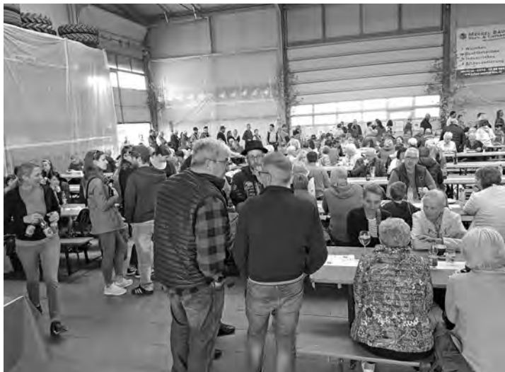
Beim Hoffest am 23.04.2023