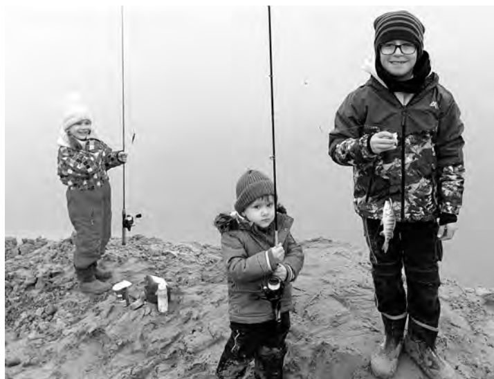
Junge Angler mit kleiner Ausbeute

Am Sonntagmorgen, 10. November 2024, machten sich trotz nebligem Wetter und kühlen 6 Grad über 30 Angler frühmorgens auf den Weg zum Kernsee, um Raubfische zu fangen.