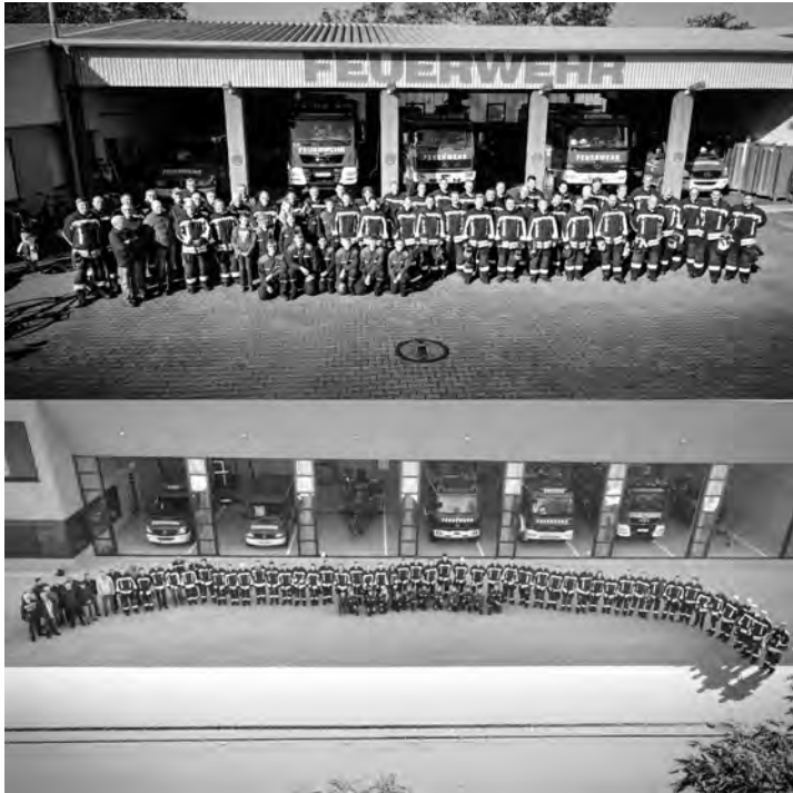
Oben: altes Feuerwehrhaus

Nach vielen Planungen, Verhandlungen und Vorbereitungen konnte der Umzug am Sonntag, 29.09.2024, der Iffezheimer Feuerwehr ins neue Feuerwehrhaus erfolgen. Alles hat reibungslos funktioniert: Mit Sondersignal wurden alle Fahrzeuge von der Karlstraße in die Hügelsheimer Straße umgestellt. Anschließend wurden die neuen Spinde eingeräumt - die Einsatzbereitschaft ist hergestellt. Das neue Haus bringt neue Abläufe, großzügige Räumlichkeiten - ein repräsentatives Domizil.