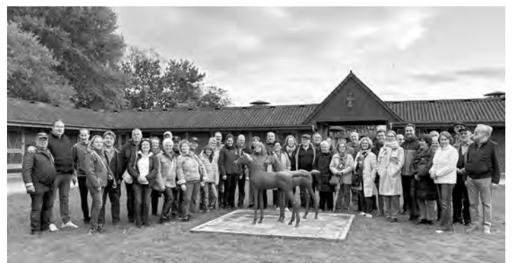
Unsere Reisegruppe versammelte sich zum obligatorischen Gruppenfoto auf dem „Brümmerhof“.