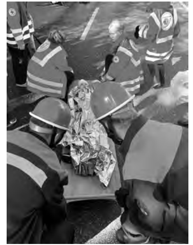
Die Jugendlichen bei der Arbeit

Für Kurzweil sorgte das Rahmenprogramm mit Hüpfburg, Kindertattoos organisiert von der Notfallseelsorge, die Fahrzeug- und Bootsausstellung, das Brandschutzmobil, diverse Infostände zur Arbeit und zu den Angeboten der Hilfsorganisationen und ihrer Jugendabteilungen, eine Übungsstation zur Reanimation und einiges mehr. Highlights waren sicherlich die gemeinsame Schauübung von Jugendfeuerwehr und Jugendrotkreuz und die Vorführung der Rettungshundestaffel des DRK.