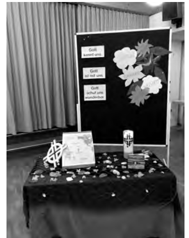
Weltgebetstag in Hügelsheim

Der Kirchengemeinderat lebt davon, dass möglichst verschiedene Stimmen, Erfahrungen und Begabungen aus der Gemeinde zusammenkommen. Denn er soll ja die ganze Gemeinde und nicht nur einen Teil davon vertreten.